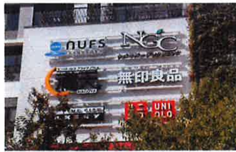
併設する「イオンモール」には、馴染みのお店から名古屋初店舗まで多数揃っています。