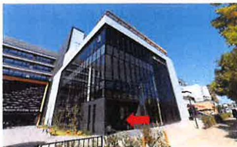
「BIZrium」6階が、名駅キャンパスです。 ここからお入りください。